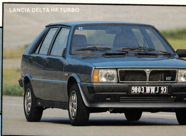
LANCIA DELTA HF TURBO