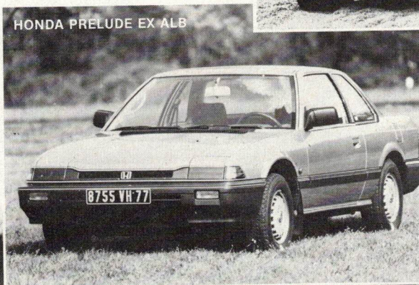
HONDA PRELUDE EX ALB