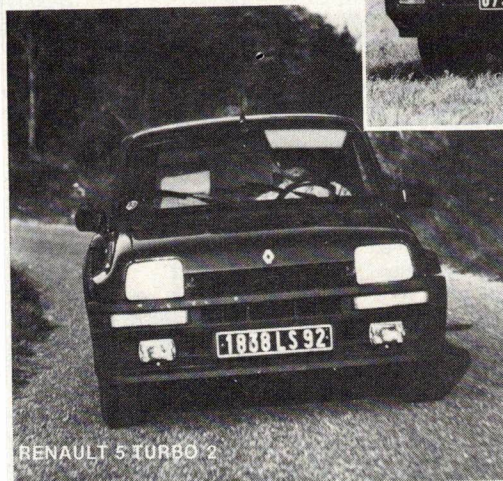
RENAULT 5 TURBO 2