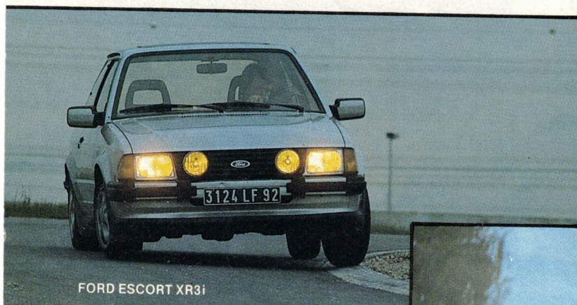
FORD ESCORT XR3i

Une anti-928S, plus spacieuse, dotée de performances d'un niveau équivalent grâce au montage de 24 soupapes de 24 cylindres à 24 soupapes de 24 cylindres. Résultat : pas vraiment un sang, mais un coupé à quatre vraies places d'une ligne aimable mais d'un tempérament méchant. Côté comportement routier, le grand jeu : spoiler, roues latérales et pneus surbaissés, suspensions revues, ABS, il y a tout ce qu'il faut. Rayon confort, c'est pareil : sièges Recaro, finition impeccable et position de conduite irréprochables. Un navire amiral en tout point digne de la flotte BMW. Mais au-delà des 286 ch et les 35 mkg