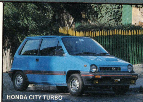
HONDA CITY TURBO