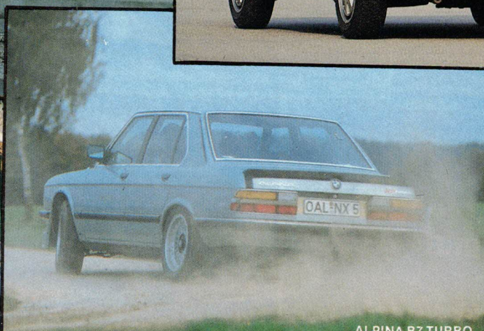
ALPINA B7 TURBO