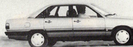
AUDI 200 TURBO