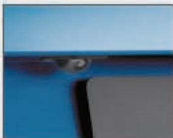
53 Caméra de recul