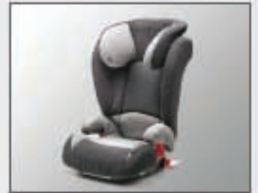
42 Siège enfant KID FIX