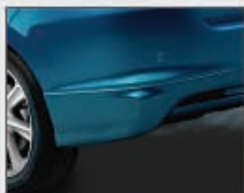
02 Jupe arrière