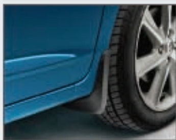
08 Bavettes avant