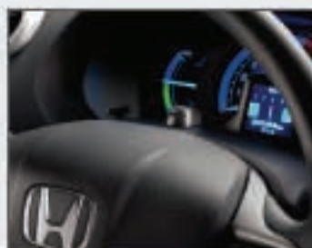
60 Micro de reconnaissance vocale