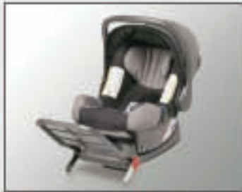
38 Siège enfant BABYSAFE ISOFIX