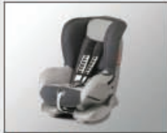
39 Siège enfant LORD