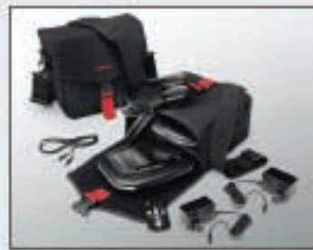
32 Sac de transport pour système de divertissement