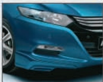
01 Jupe avant