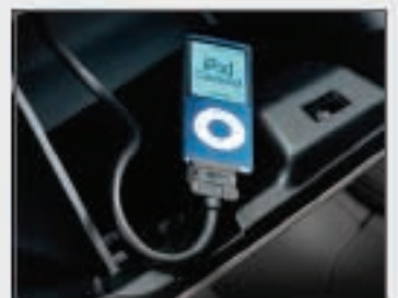
58 Adaptateur pour iPod®