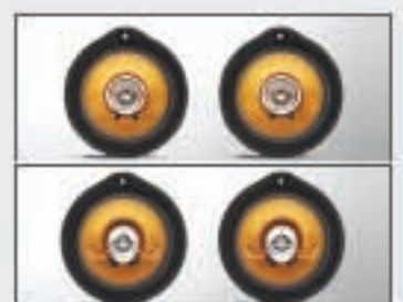
Kit haut-parleurs 63 à double cône 64 coaxiaux