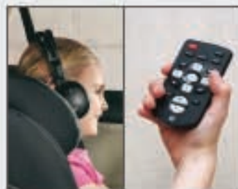
55 Ecouteurs 56 Télécommande