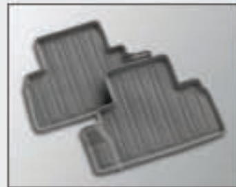
36 Jeu de tapis arrière en caoutchouc