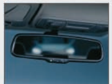
52 Rétroviseur intérieur anti-éblouissant automatique