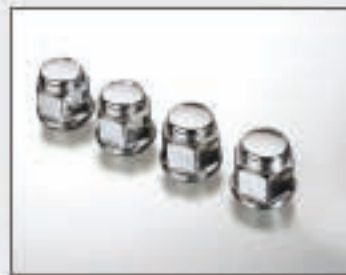
21 Ecrous de jante (20 pièces)