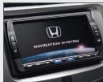
57 Système de navigation SSD