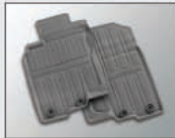
35 Jeu de tapis avant en caoutchouc