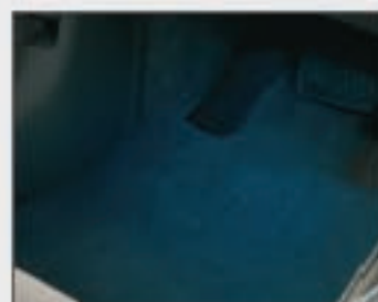
51 Eclairage ambiant bleu