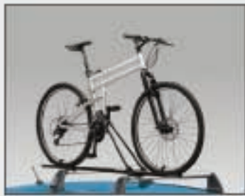
25 Support à vélo classique