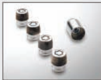
20 Ecrous antivol