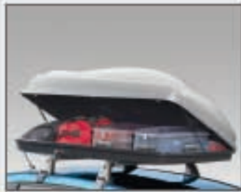
24 Top Box 350 litres