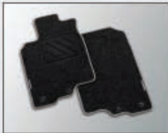
33 Jeu de tapis standard