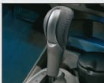
48 Pommeau de levier de vitesses