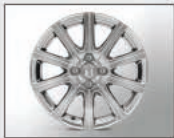
18 Jantes alu 16"