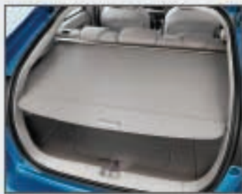
30 Tablette arrière