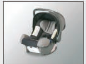
37 Siège enfant BABYSAFE