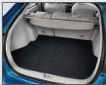
28 Tapis de coffre