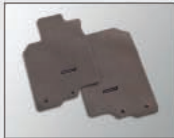
34 Jeu de tapis «Élégance»