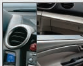
50 Garnitures de tableau de bord