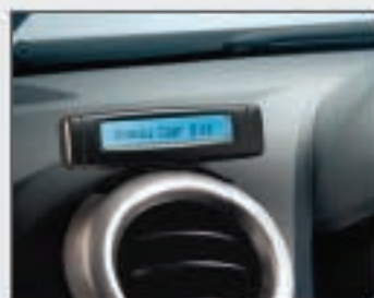
61 Kit Bluetooth®