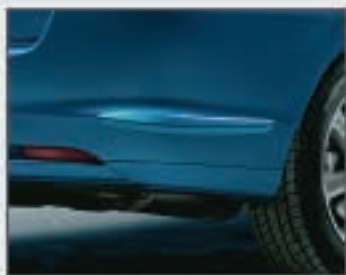
06 Protections pour pare-chocs arrière