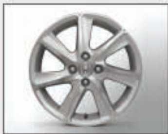
19 Jantes alu 16" TURBINE