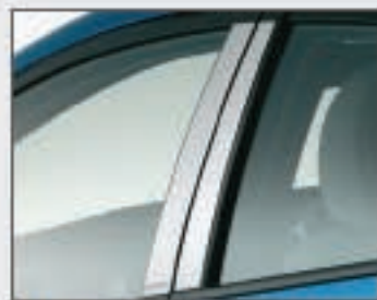
10 Garniture chromée pour montants de portes