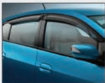
13 Défecteurs de portes