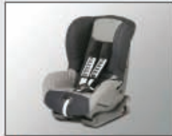
40 Siège enfant DUO ISOFIX