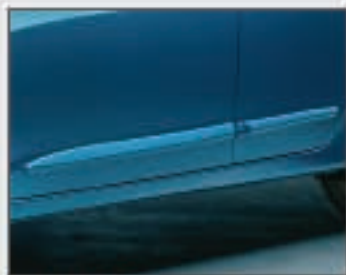
07 Protections des portes latérales