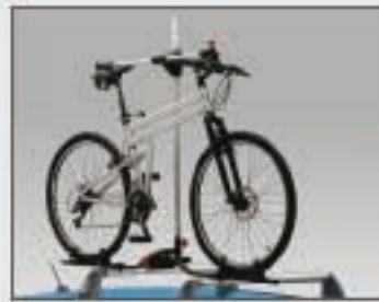
27 Porte-vélo automatique