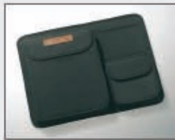
31 Pochette siège arrière