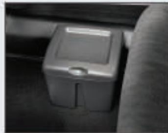
45 Poubelle d'intérieur