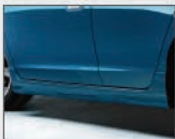
03 Jupes latérales