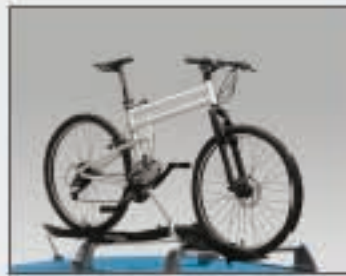
26 Support à vélo de luxe