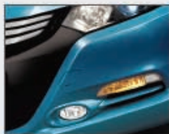
14 Phares antibrouillard avant