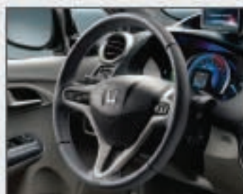
49 Volant en cuir