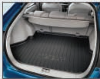
29 Bac de coffre