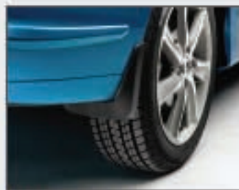
09 Bavettes arrière