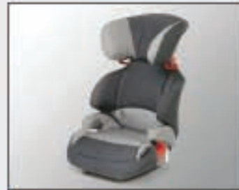
41 Siège enfant KID