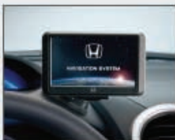
59 Système de navigation portable ultra-compact Honda