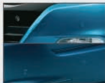
15 Aides au parcage avant 16 Aides au parcage arrière