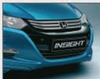
04 Garniture de pare-chocs avant