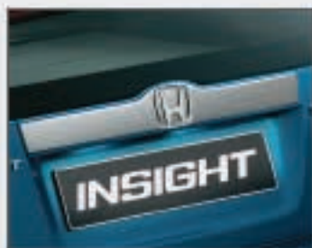
12 Garniture chromée de hayon