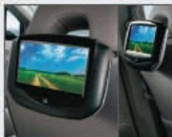
54 1 er / 2 e écran du système de divertissement