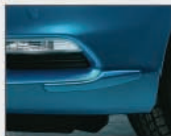
05 Protections pour pare-chocs avant