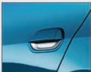
11 Habillage chromé des poignées de portes