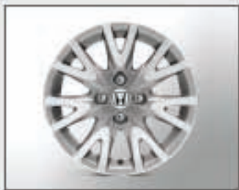
17 Jantes alu 15" CRYSTAL