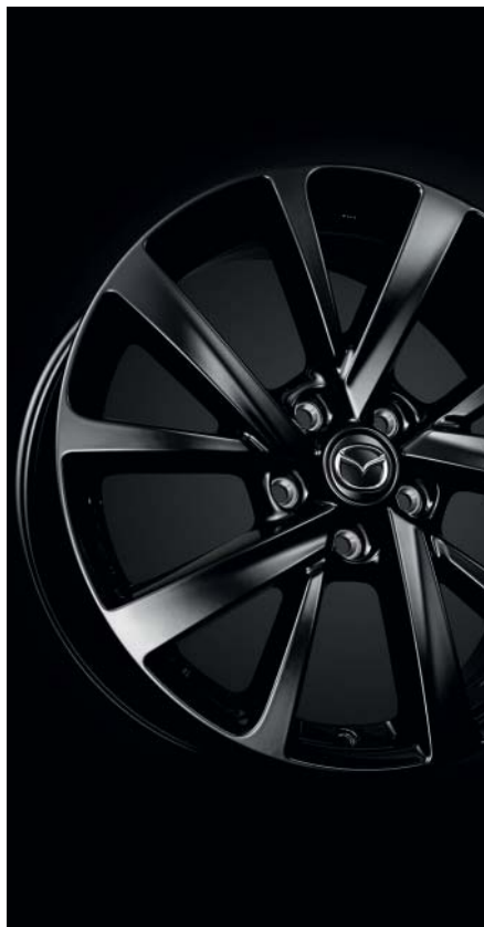
JANTE ALUMINIUM 18" 7 x 18", design 72A, Noir brillant, déport de 45 mm BDEL-V3-810A-BL