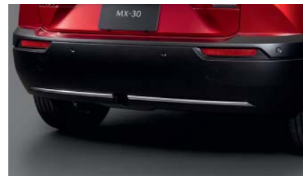
Pack d'Inserts extérieurs Insert arrière DN4J-V3-050