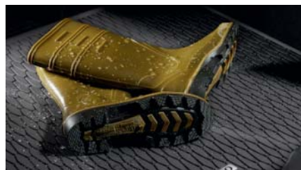
BAC DE COFFRE Protégez votre coffre avec ce bac de coffre. DN4J-V0-370