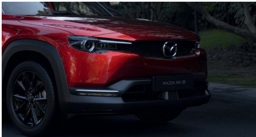
Pack d'Inserts extérieurs Insert avant DN4J-V3-050