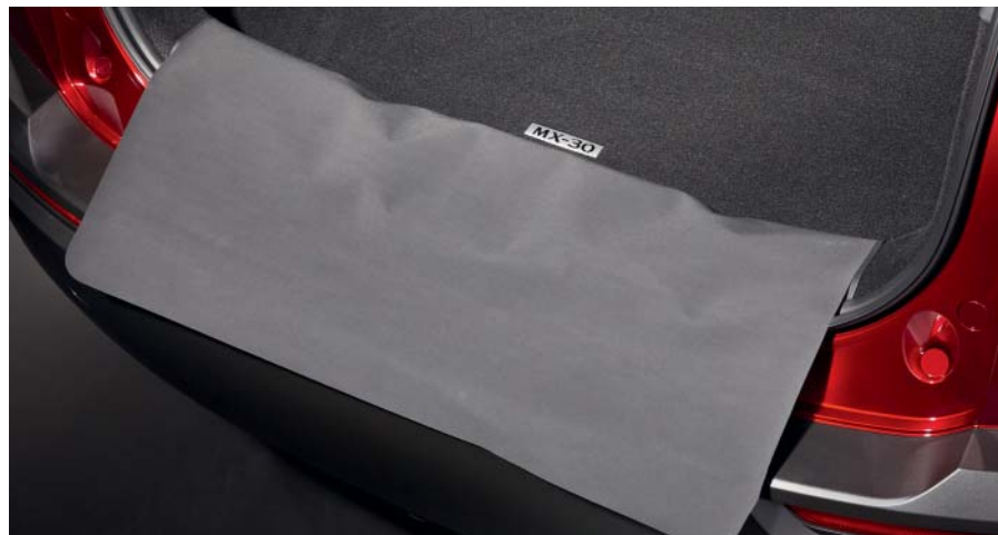
TAPIS DE COFFRE AVEC PROTECTION REPLIABLE DE PARE-CHOC Tapis de coffre avec logo MX-30 en métal et protection de pare-choc repliable. DN4J-V0-381

Protégez votre Mazda MX-30 en toutes circonstances.