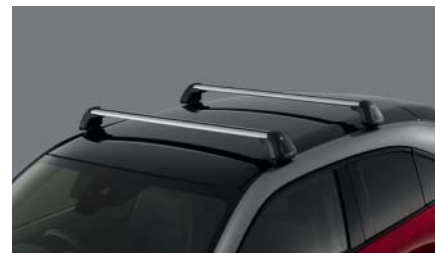
BARRES DE TOIT