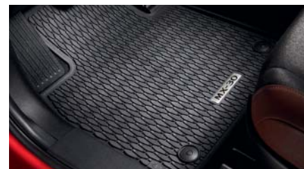
TAPIS CAOUTCHOUC Lot de 4 pièces (avant et arrière). Noir avec logo MX-30 en métal. DN4J-V0-350