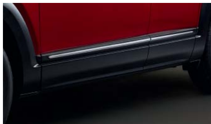
Pack d'Inserts extérieurs Jupes latérales DN4J-V3-050