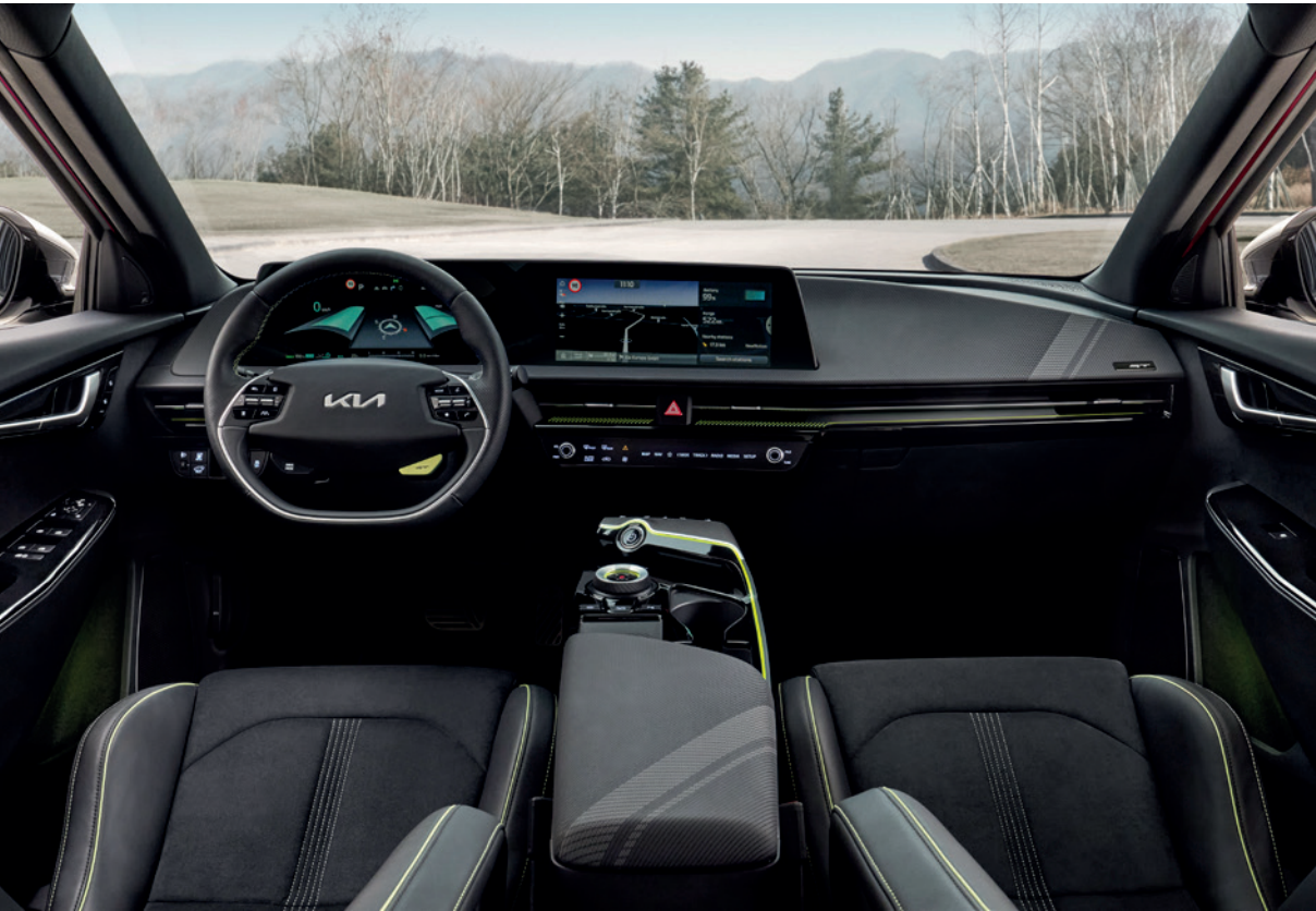
Certaines informations sont communiquées à titre indicatif et sont sujettes à modification en attendant l'homologation de cette version.