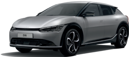
Moonscape (Matte) (KLM)