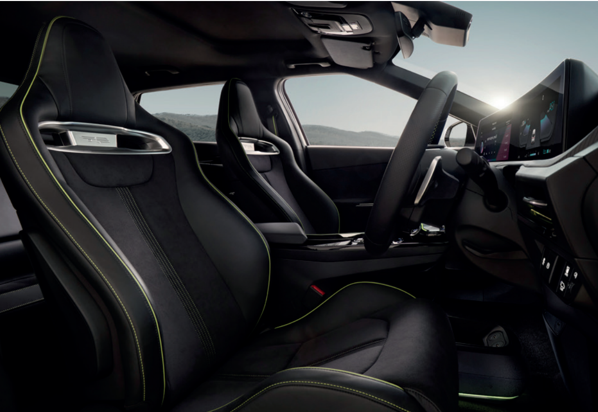
Sellerie sport en cuir végétal et suède noir