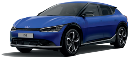
Yacht Blue (DU3)*