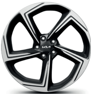
Jantes en alliage 8.5J x 21" avec pneus 255/40 R21