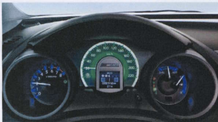
Eclairage du tableau de bord