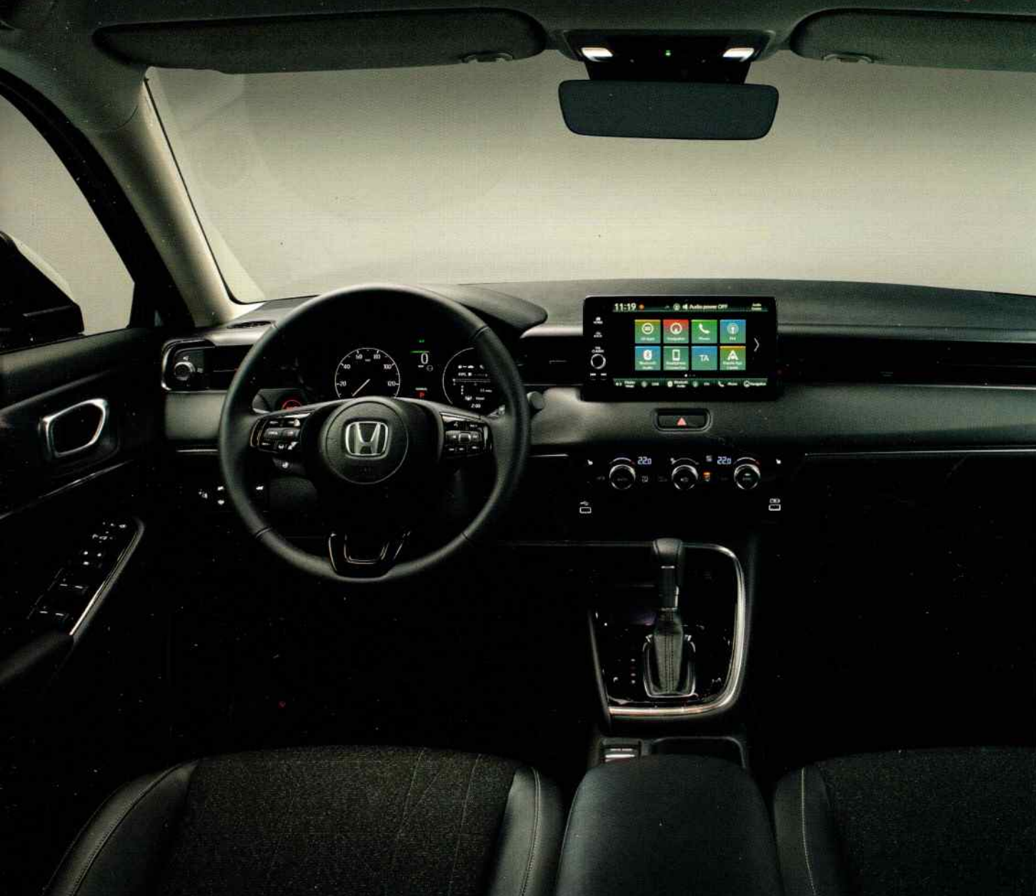
Le nouveau Honda HR-V