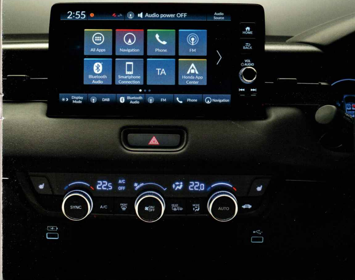
Le nouveau Honda HR-V