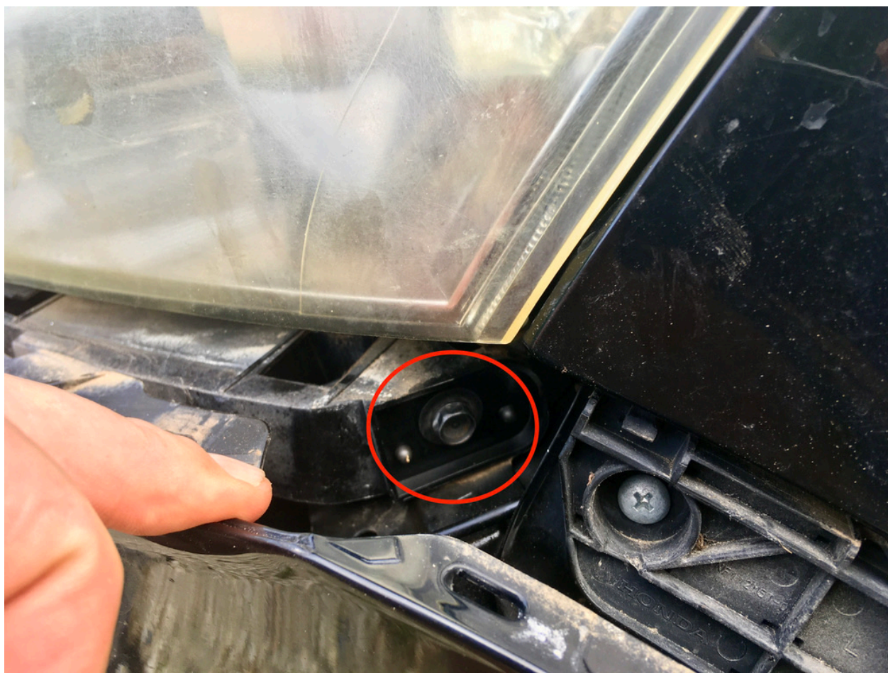
Vis de fixation de logique et une autre a cotés du Klaxon