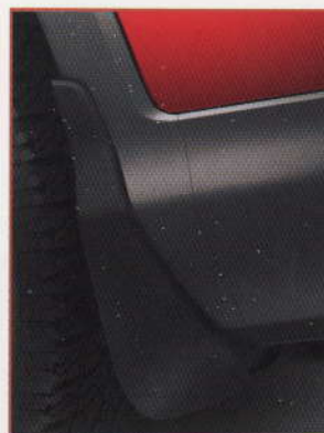
BAVETTES AVANT ET ARRIÈRE