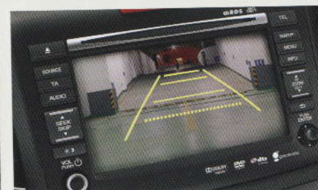
CAMÉRA DE RECUL