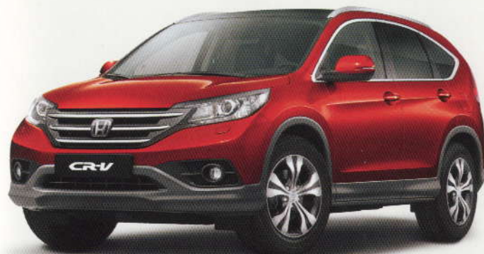
Rouge «Passion» Pearl (R-539P)