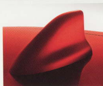
ANTENNE DE TOIT