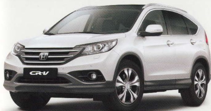
Blanc «Orchid» Pearl (NH-788P)