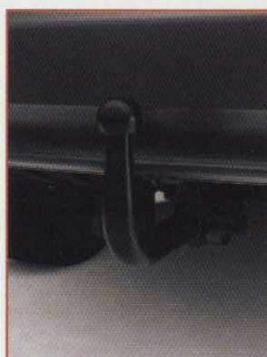
ATTELAGE FIXE OU AMOVIBLE