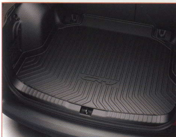
BAC DE COFFRE