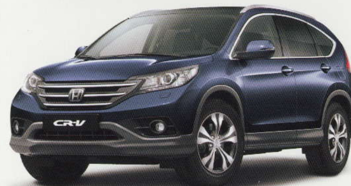
Bleu « Twilight » métallisé (B-570M)