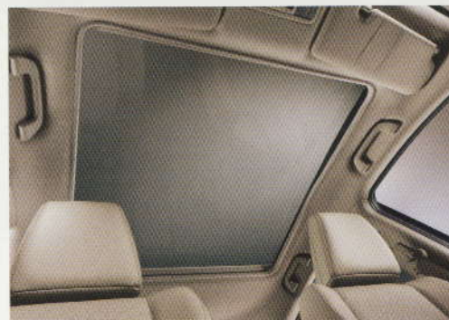
TOIT PANORAMIQUE EN VERRE