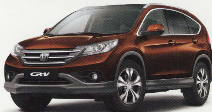
Bronze « Ionised » métallisé (YR-580M)