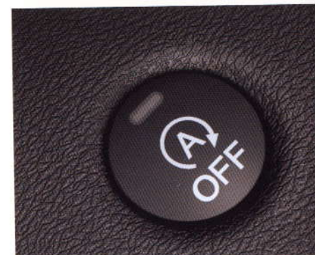
IDLE STOP (STOP & START)