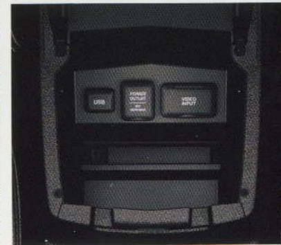
PRISE AUXILIAIRE ET PORT USB