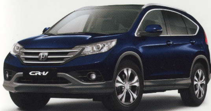
Bleu «Deep Ocean» (B-580)

CR-V 2.2 i-DMTEC Executive avec jantes alu 17" de série et aides à la conduite ADAS en option.