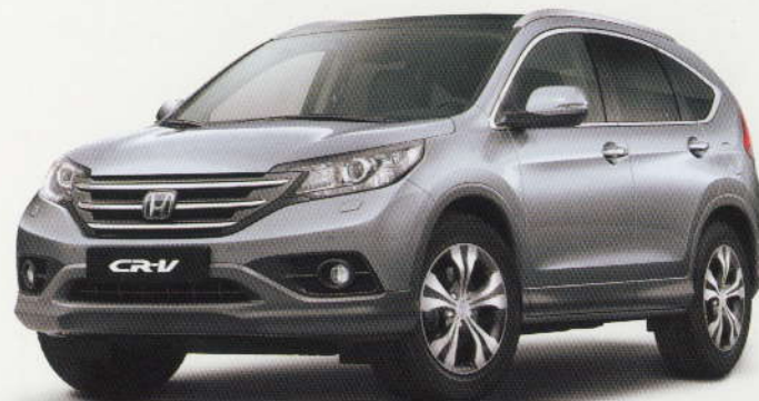
Gris « Alabaster » métallisé (NH-700M)