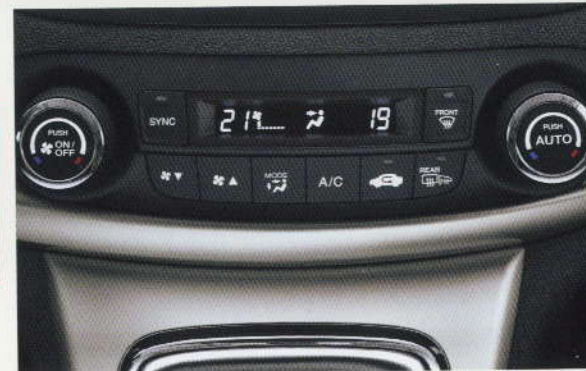
CLIMATISEUR AUTOMATIQUE BI-ZONE