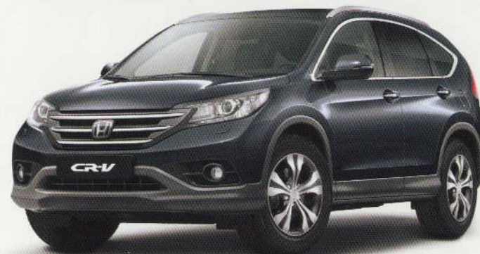
Gris « Polished » métallisé (NH-737M)