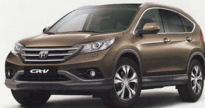
Gris « Urban Titanium » métallisé (YR-578M)