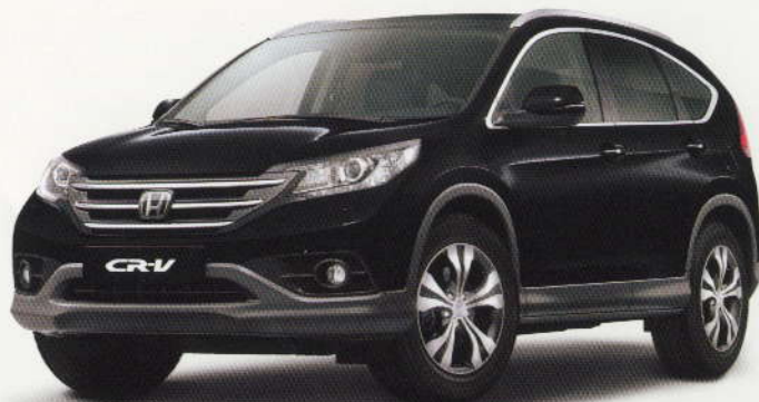
Noir « Crystal » Pearl (NH-731P)

Du noir au bronze en passant par un beau rouge « Passion », elles mettent en valeur votre CR-V.