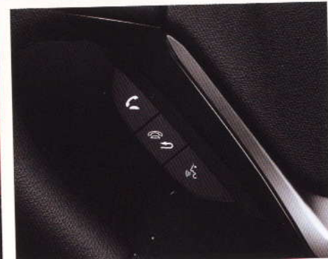
TÉLÉPHONIE MAINS LIBRES BLUETOOTH®