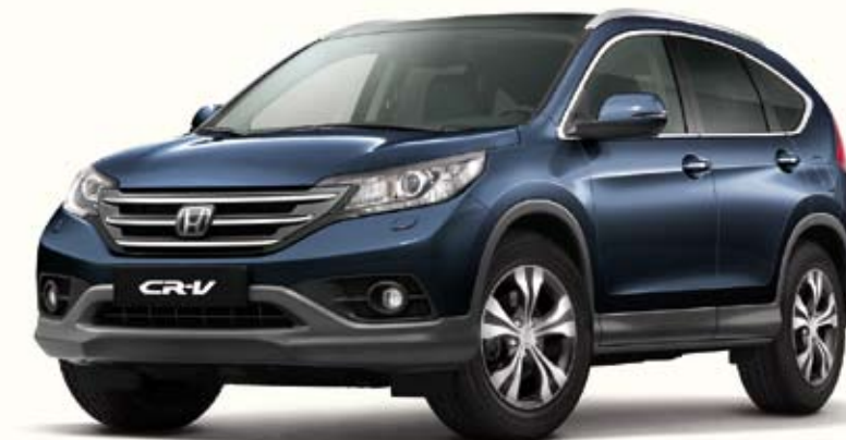
B570 Twilight Blue Metallic