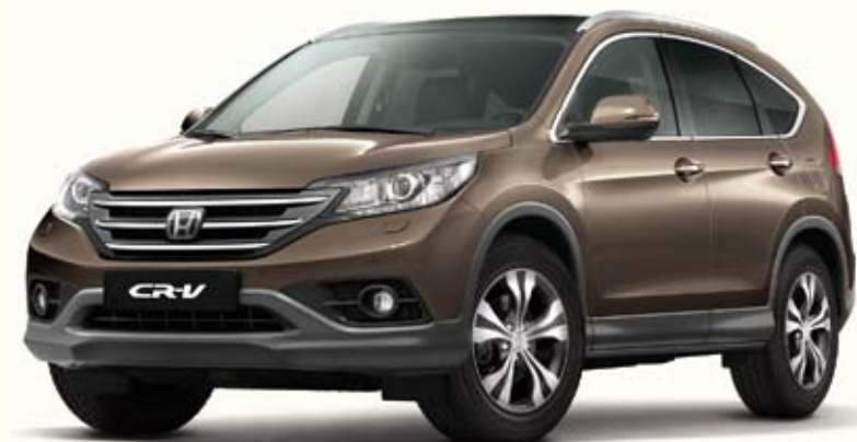
YR578 Urban Titanium Metallic