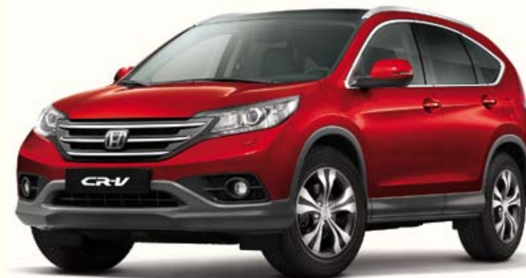
R539 Passion Red Pearl

Plutôt Noir Cristal, Blanc Orchidée ou Rouge Passion ? Avec une large palette de coloris, il y'en a forcément une qui conviendra à votre style et votre personnalité.