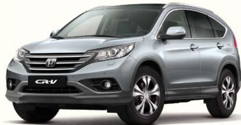
NH700 Alabaster Silver Metallic