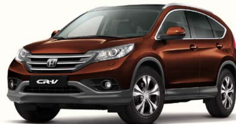
YR580 Ionised Bronze Metallic