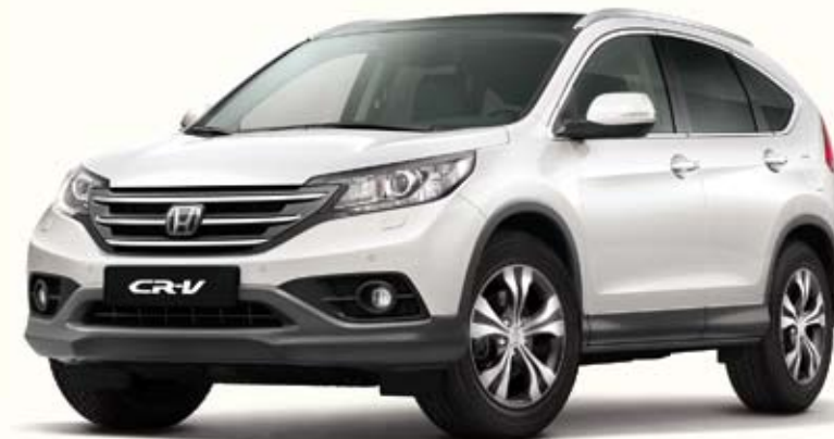
NH788 White Orchid Pearl