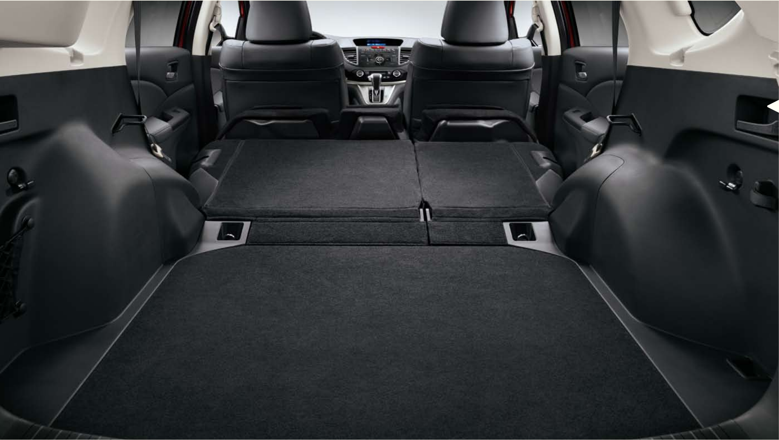
Banquette arrière Magique (rabattable 60/40 en un seul geste)