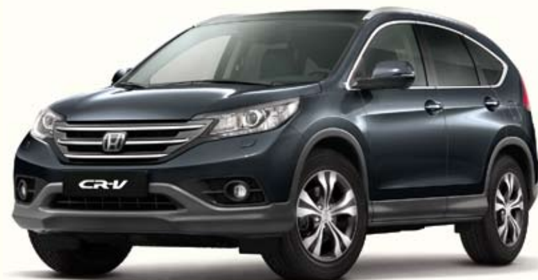
NH737 Polished Metal Metallic