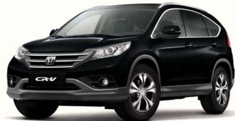
NH731 Crystal Black Pearl