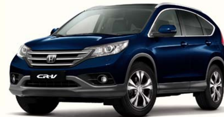
B580 Deep Ocean Blue