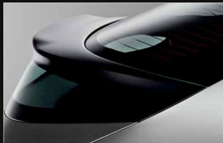
Le spoiler arrière plaque fermement la Civic sur la route sans gêner la vision arrière grâce à une zone de verre située juste en dessous.