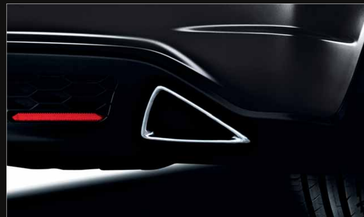
Sortie d'échappement triangulaire , double et séparée.*

*Equipements disponibles selon les versions, renseignez-vous chez votre concessionnaire.