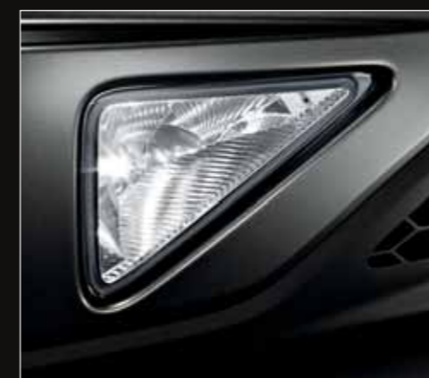
Situés dans le pare-chocs, les antibrouillards avant sont à la fois d'un design réussi et très puissants.*