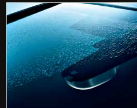
Quand les premières gouttes de pluie tombent sur le pare-brise, les essuie-glaces se mettent en marche automatiquement*.