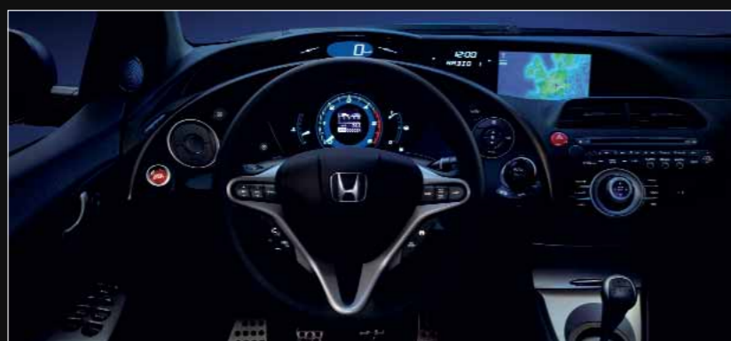
Version Executive Navi Cuir