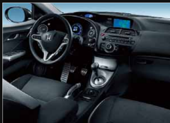
Version Sport Navi