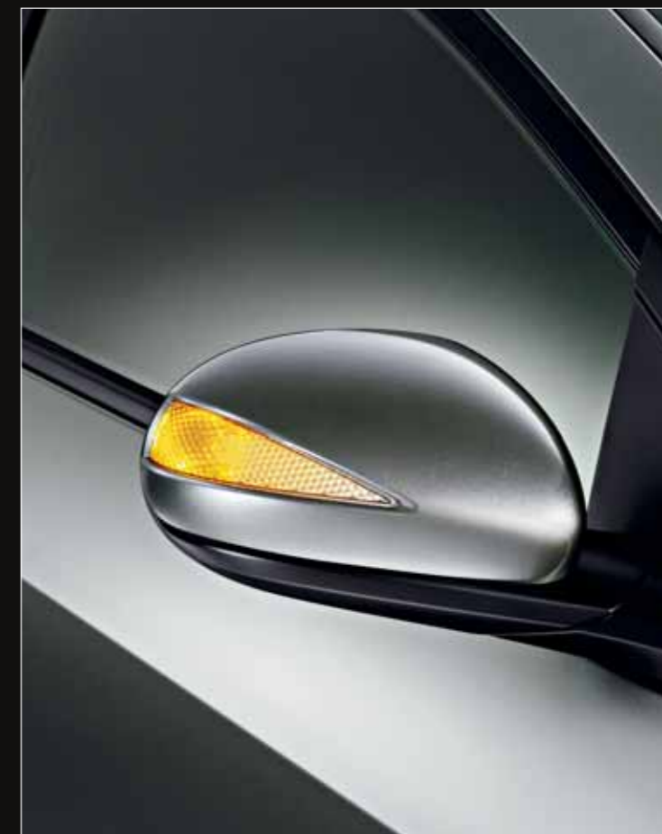
Répétiteurs de clignotants dans les rétroviseurs.