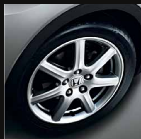
Des roues de 17 pouces sept branches pour une finition marquée et encore plus d'adhérence.*