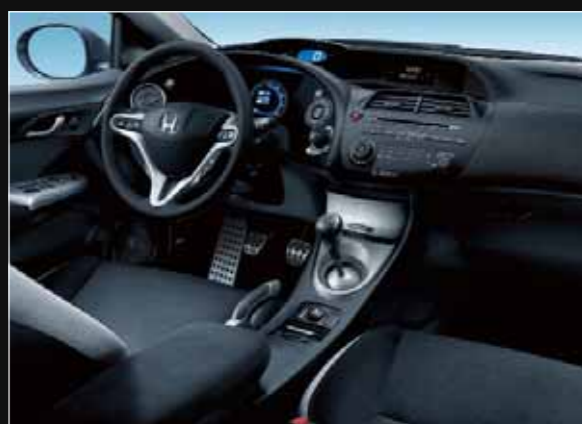
Version Sport / Executive