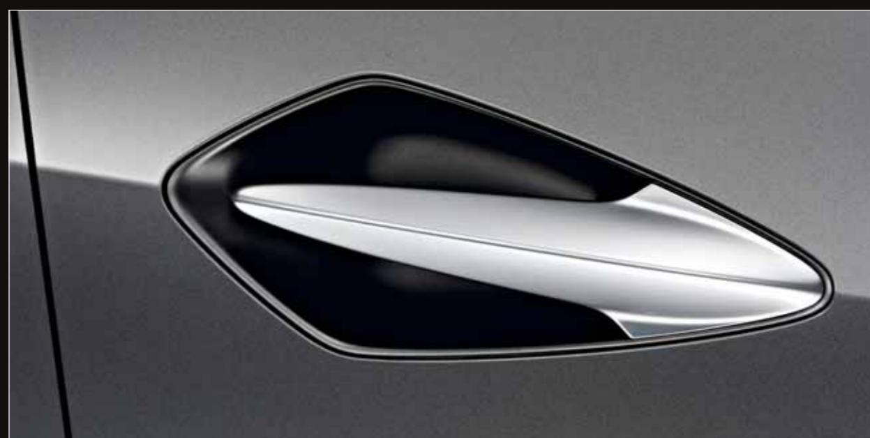
Poignées de porte avant masquées pour encore plus de discrétion et de dynamisme.