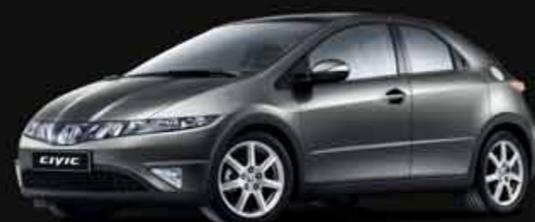
Version Sport / Sport Navi