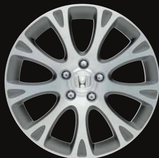
Jantes alliage 18" dans une superbe version 9 branches.