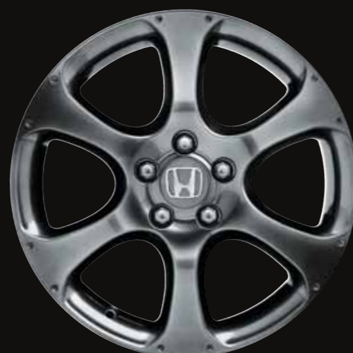
Jantes alliage 18" dans une superbe version shadow 6 branches.

Adapteur iPod® pour la Civic. Il vous permet de connecter facilement votre iPod® et d'écouter votre répertoire musical digitalisé au travers du système audio de la Civic.