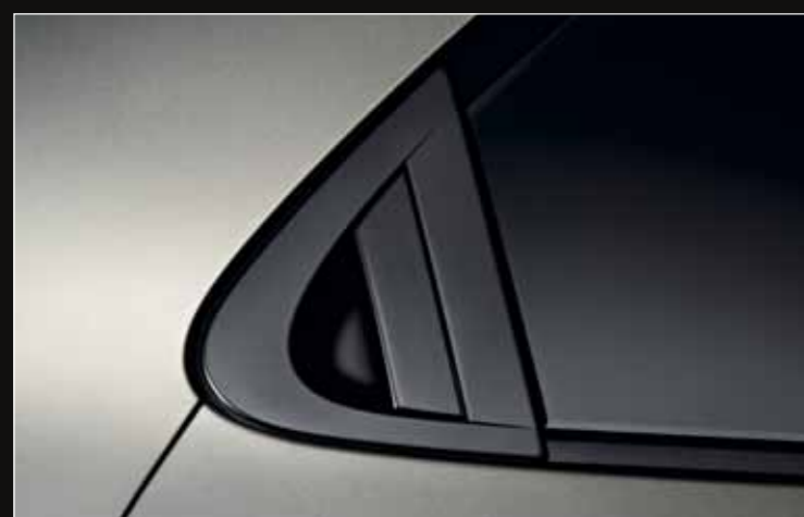
Intégrées et affleurantes à la carrosserie, les poignées des portes arrière sont discrètes et préservent l'aspect dynamique d'une 3 portes tout en offrant la praticité d'une 5 portes.